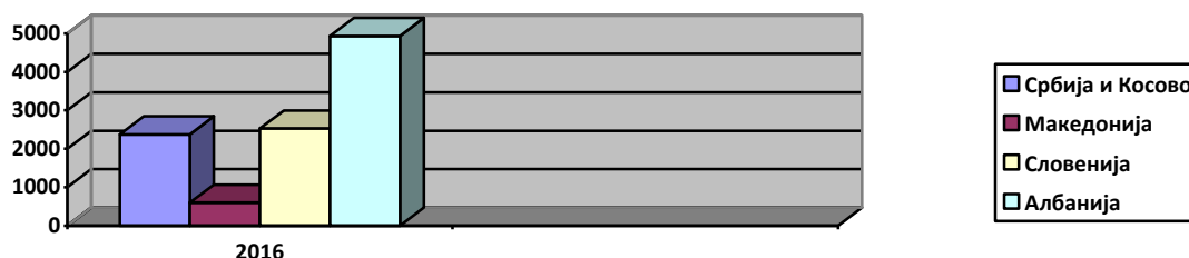
Графикон 1: Статистички податоци за лица без државјанство

* Податоците се превземени од Statelessness, Discrimination and Marginalisation of Roma in the Western Balkans and Ukraine , Октомври 2017